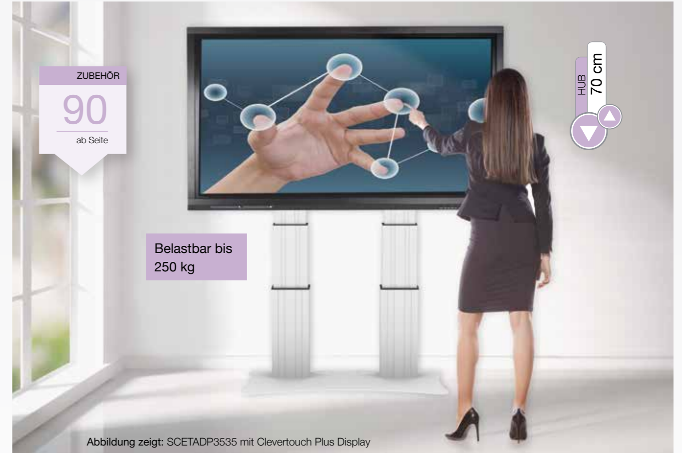
Abbildung zeigt: SCETADP3535 mit Clevertouch Plus Display