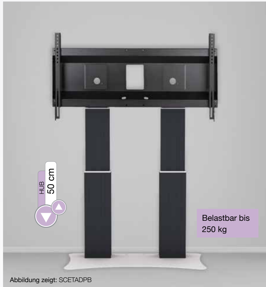
Abbildung zeigt: SCETADPB