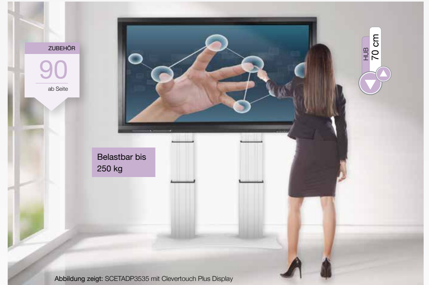
Abbildung zeigt: SCETADP3535 mit Clevertouch Plus Display