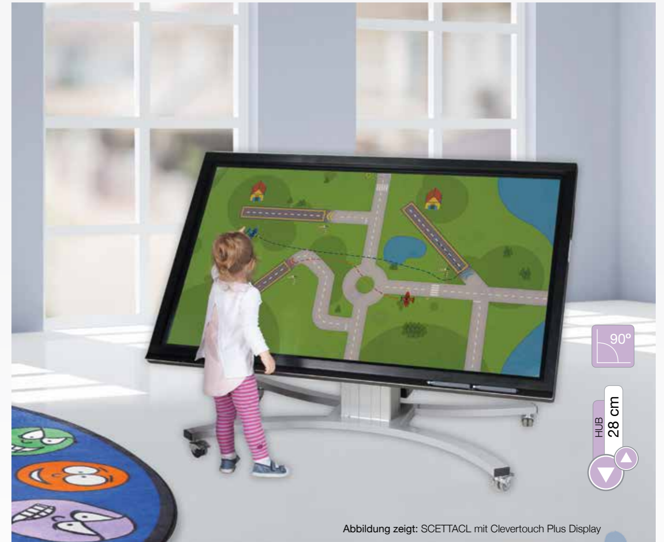
Abbildung zeigt: SCETTACL mit Clevertouch Plus Display