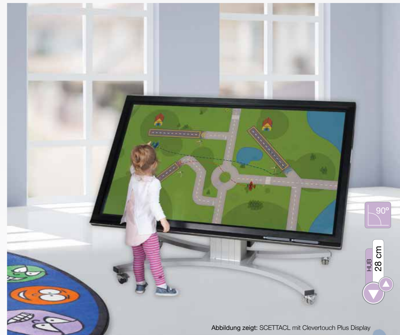
Abbildung zeigt: SCETTACL mit Clevertouch Plus Display