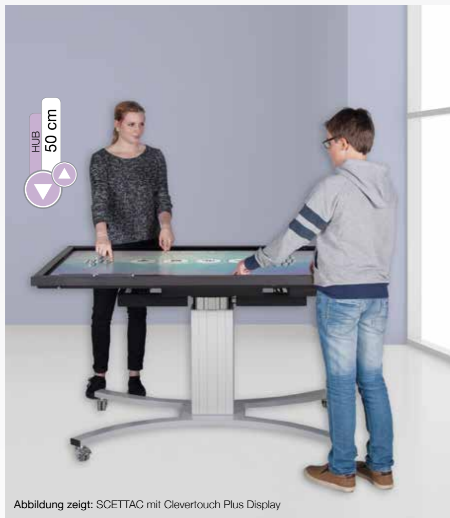
Abbildung zeigt: SCETTAC mit Clevertouch Plus Display