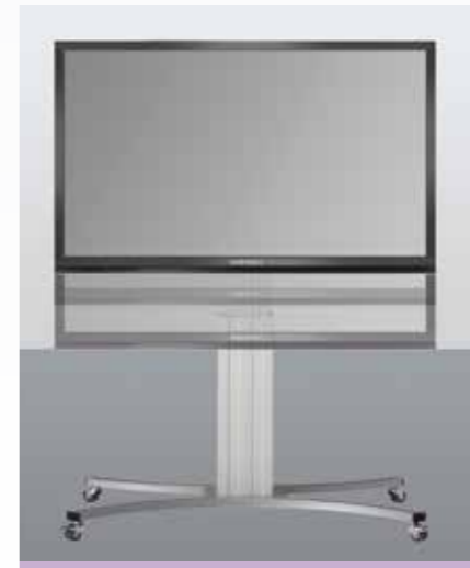
Höhenverstellbar im Tafelmodus