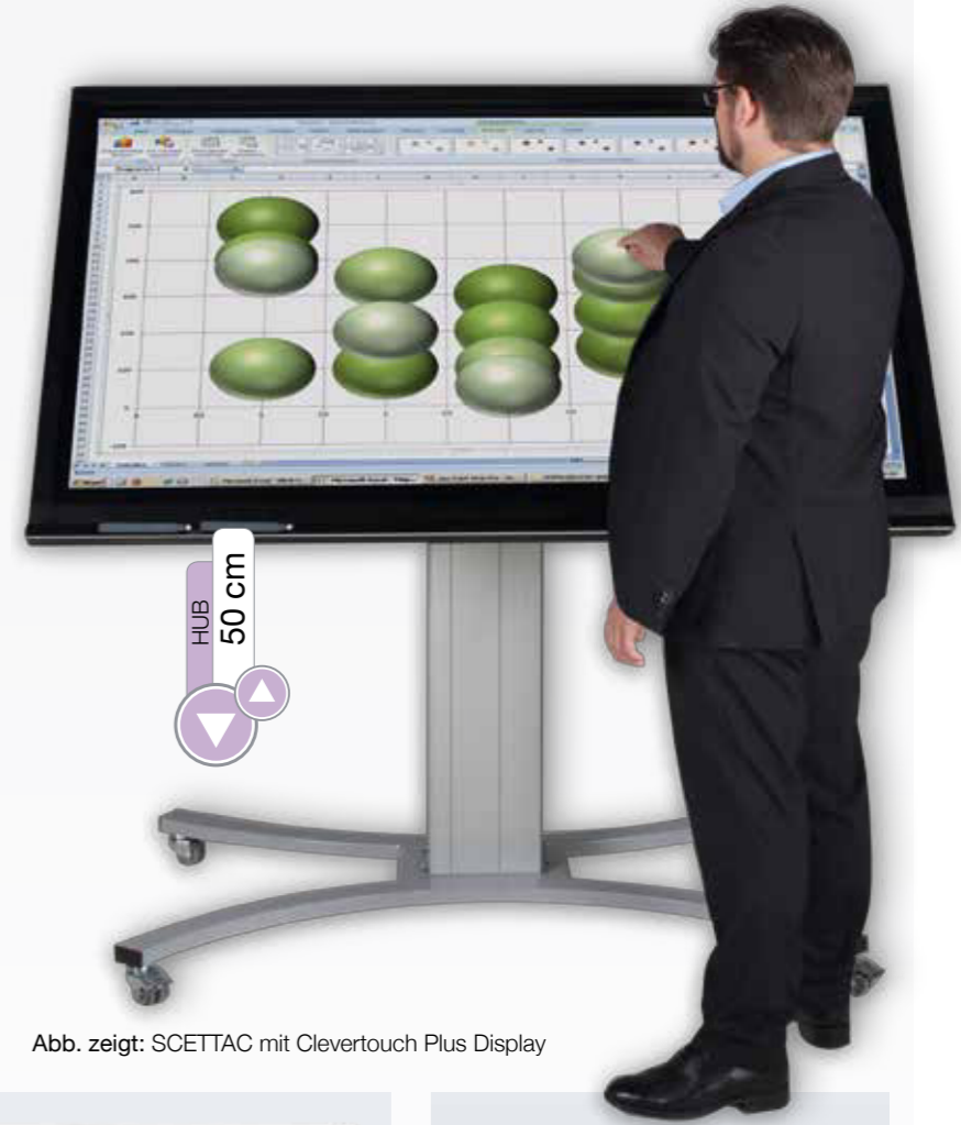
Abb. zeigt: SCETTAC mit Clevertouch Plus Display

Die Systeme der folgenden Seiten lassen sich sowohl in der Höhe verstellen als auch bis zu 90° neigen. So können sie auch als interaktive Tischsysteme benutzt werden. Sie haben die Möglichkeit, das System in jedem Winkel zu stoppen.