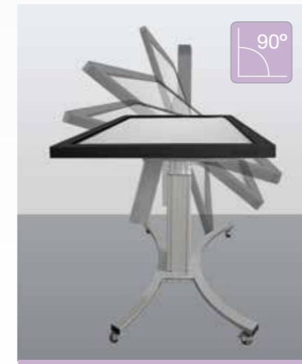
0 – 90° verstellbar