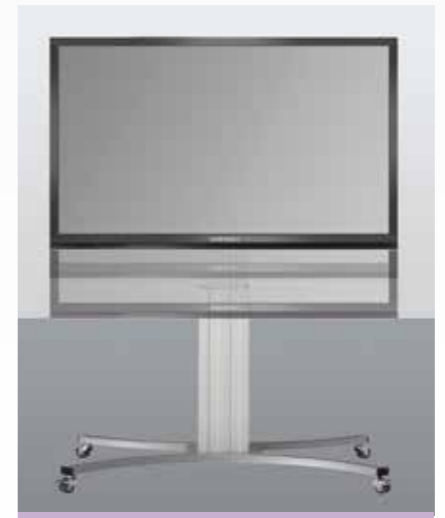
Höhenverstellbar im Tafelmodus