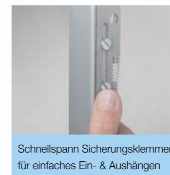
Schnellspann Sicherungsklemmen für einfaches Ein- & Aushängen