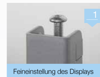
1 Feineinstellung des Displays