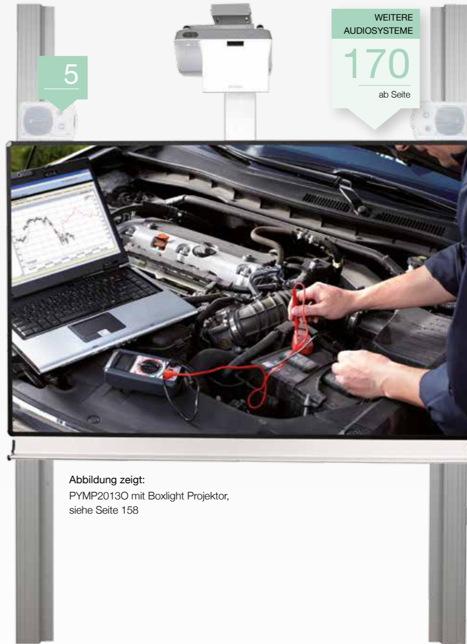
Abbildung zeigt: PYMP2013O mit Boxlight Projektor, siehe Seite 158