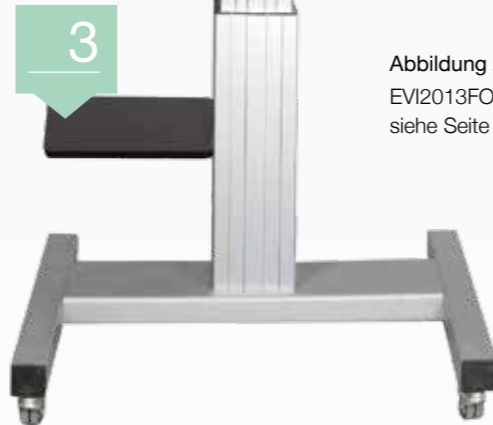
Abbildung zeigt: EVI2013FO mit Vivitek Projektor, siehe Seite 150