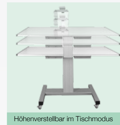
Höhenverstellbar im Tischmodus