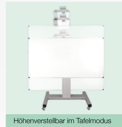
Höhenverstellbar im Tafelmodus

Dieser workITdesk ist stufenlos höhenverstellbar, der Schiebeweg beträgt 50 cm. Neben der Höhenverstellung haben Sie auch die Möglichkeit, den Tisch in jedem beliebigen Winkel abzustoppen und in dieser Stellung auch die Höhe anzupassen.