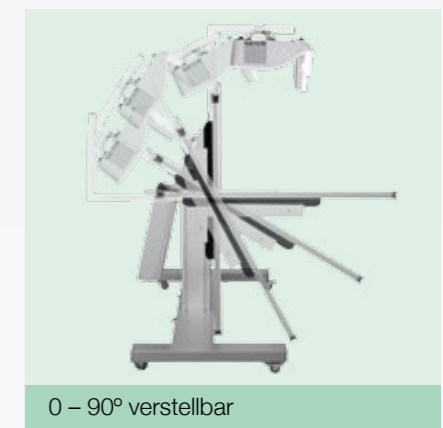
0 – 90° verstellbar