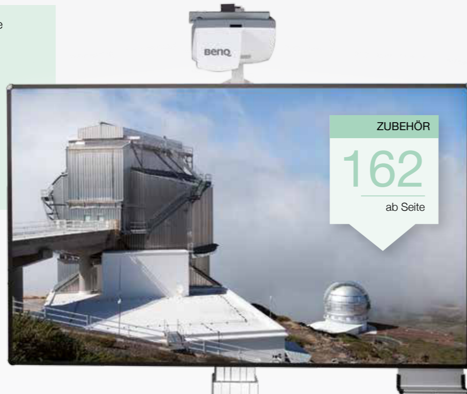
Abbildung zeigt: EVI2013FO mit Benq Projektor