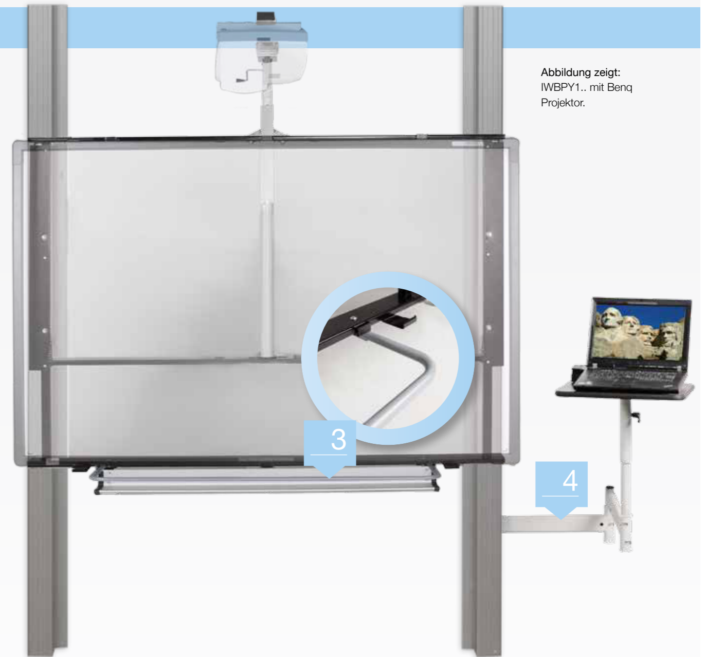
Abbildung zeigt: IWBPY1.. mit Benq Projektor.