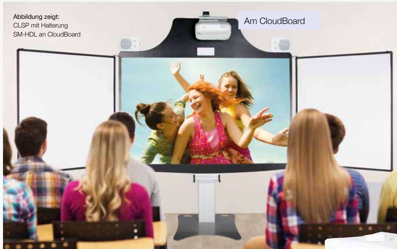
Abbildung zeigt: CLSP mit Halterung SM-HDL an CloudBoard