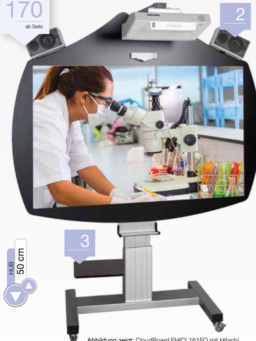
Abbildung zeigt: CloudBoard EHICL161FO mit Hitachi Projektor und Fingertouch-Modul, siehe Seite 119