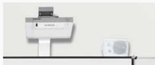
Mit Halterung SM-HDL