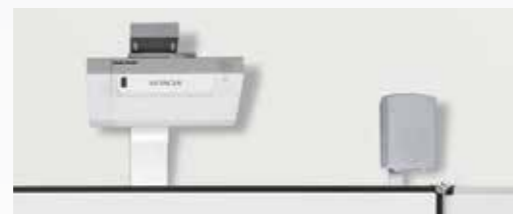
Mit Halterung SM-HDT